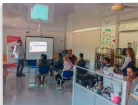
Estrategias de ventas para el sector turístico - Municipio de San Luis de Gaceno