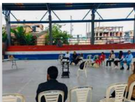
Prevención de atropellamiento de fauna - Municipio de Garagoa