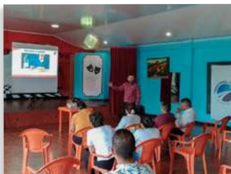
Fotografía de productos con celulares - Municipio de Macanal

La Concesión Transversal del Sisga, a través del programa de capacitaciones a la comunidad, continúa brindando espacios educativos y de aprendizaje con las comunidades aledañas al proyecto, en los cuales se abordan temas relacionados con la protección de la fauna y el medio ambiente, la prevención de riesgos y el mejoramiento del entorno. De igual manera, seguimos trabajando de la mano con la Cámara de Comercio de Tunja, con quien se han promovido espacios encaminados en fortalecer el desarrollo turístico y comercial de la región, potencializando los beneficios generados por la rehabilitación de la vía y atendiendo el auge en la generación de nuevos comercios.