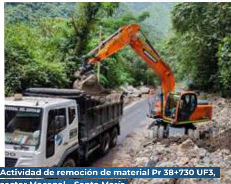
Actividad de remoción de material Pr 38+730 UF3, sector Macanal – Santa María

Agradecemos a todos nuestros colaboradores por su compromiso para superar esta crítica situación. Continuaremos trabajando 24/7 para garantizar la transitabilidad y conectividad segura de todos los usuarios.