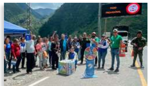
Campaña de seguridad vial con enfoque en la prevención del atropellamiento de fauna

¡RECUERDA QUE TUS DECISIONES EN LA VÍA SALVAN VIDAS!