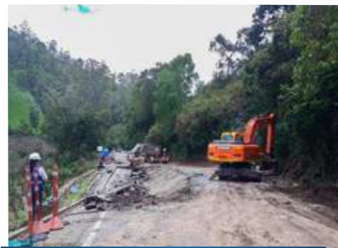
Reconformación de paso provisional a un solo carril – Pr 35+000 – sector Tibirita - Guateque