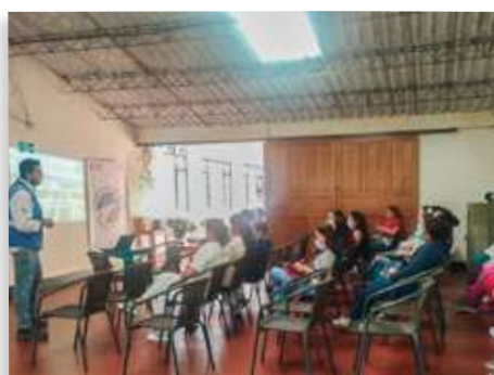
Ética y confidencialidad en el manejo de la información - Municipio de Garagoa