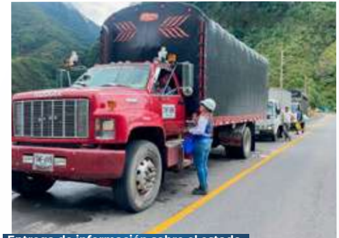
Entrega de información sobre el estado de la vía a usuarios del corredor