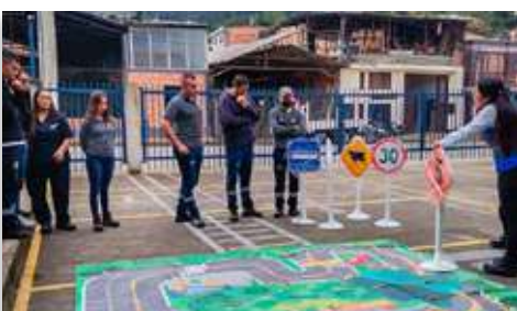
Centro Diagnóstico Automotriz CDA – Municipio de Garagoa