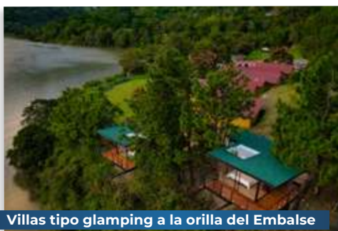
Villas tipo glamping a la orilla del Embalse La Esmeralda.

Si deseas conocer más acerca de los planes que ofrece el Hotel Sinaí, puedes comunicarte a través de los siguientes canales: