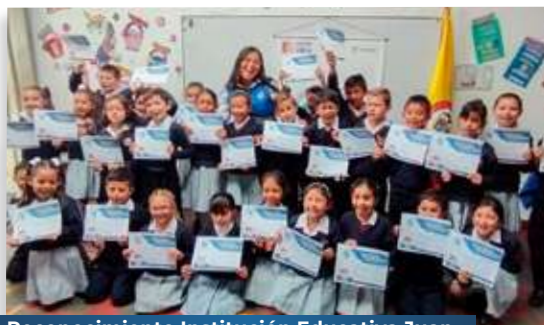
Reconocimiento Institución Educativa Juan José Neira - Municipio de Machetá

A lo largo del año 2023, la iniciativa se ha desplegado con éxito en 12 escuelas aledañas al corredor vial, en la que han participado más de 160 estudiantes y más de 12 maestros.