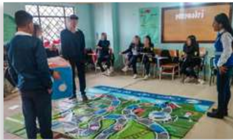
I.E. Monseñor Agustín Gutierrez – municipio de Tibirita