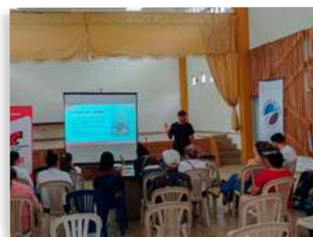
Turismo y marketing digital- Municipio de Santa María