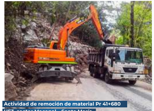
Actividad de remoción de material Pr 41+680 UF3, sector Macanal – Santa María