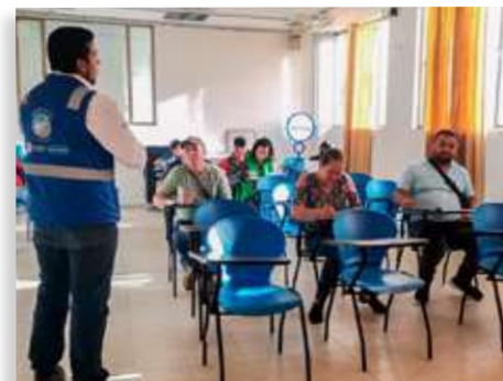
Prevención del consumo de alcohol en conductores - Municipio de Macanal