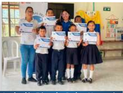
Institución Educativa Jacinto Vega sede Piedra Campana - Municipio de Macanal