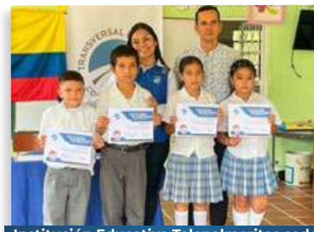
Institución Educativa Telepalmeritas sede La Frontera - Municipio de San Luis de Gaceno