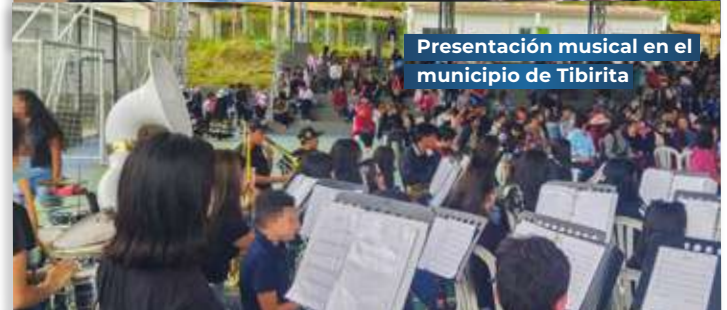
Presentación musical en el municipio de Tibirita