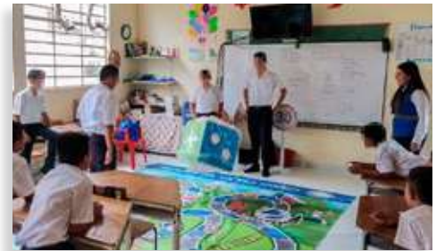
I.E. Nueva Esperanza – centro poblado Santa Teresa – San Luis de Gaceno