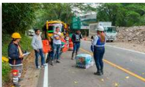
Sensibilización de seguridad vial dirigida a transportadores