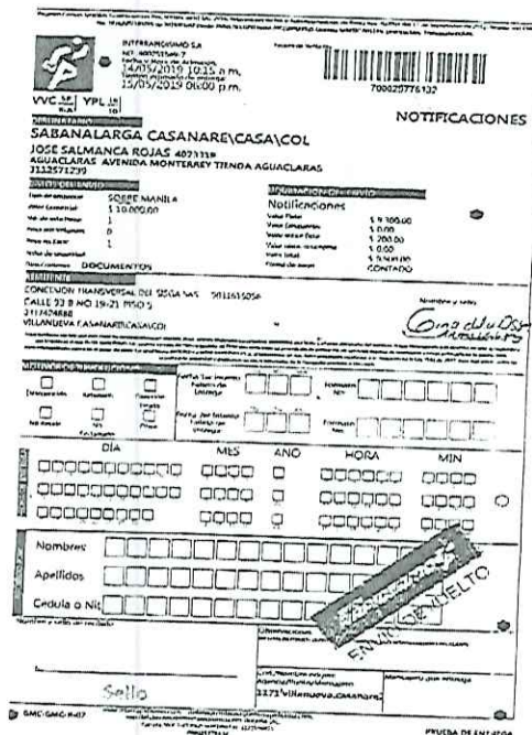
IMAGEN PRUEBA DE ENTREGA DE LA DEVOLUCIÓN